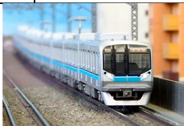
写真は前回製品です。