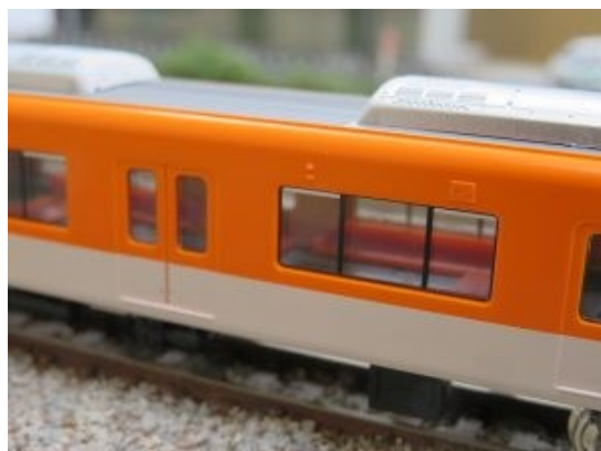
両先頭車ともにロングシートを再現。シートの色もオレンジ