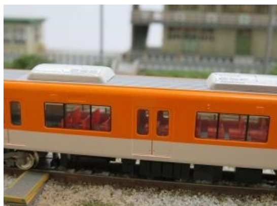
中間車の座席はいずれもクロスシート