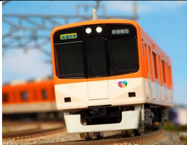
写真は試作品です。