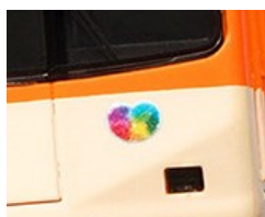
“たいせつ”がギュッと。マーク