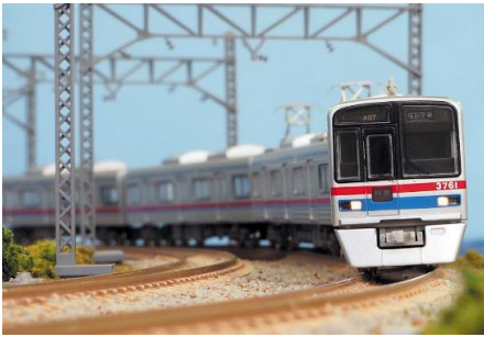
京成電鉄商品化許諾済

京成3700形は、1991年の成田空港ターミナル直下への乗り入れと北総開発鉄道公団線2期線の開通を機に導入され、京成電鉄の新規製造通勤形車両としては初めてVVVFインバータ制御を採用し初代3000形から3150形等の置き換えを目的として、2002年までに8両編成15本・6両編成2本の計132両が製造されました。1～9次車まで製造され、前面ライトの位置や前面種別部分、室内等にそれぞれ違いが見られます。3次車は95年度に登場したグループで、3758編成～3788編成の4編成が該当します。3次車は登場当初、スカートが六角形の形状で登場しましたが後に現行の形状に交換されました。室内シートがオレンジ模様入りの個別シートに変更になりました。2012年以降、改修工事が順次行われており側窓の半数が固定化、室内床張替え、扉部に黄色テープの貼り付け等が施工されています。2015年の3768編成以降は側面の窓ガラスをUVカットのものに交換されています。製品の3768編成は室内灯も改修工事と同時にLED照明に変更されています。