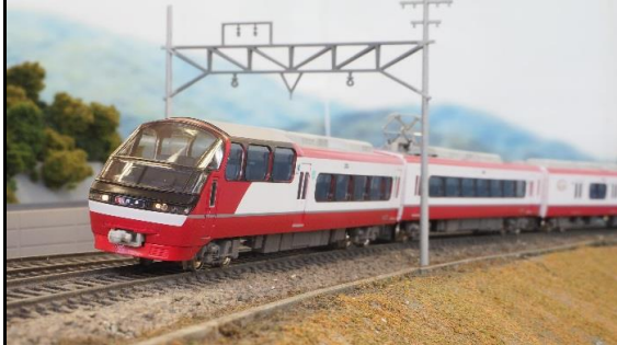
名古屋鉄道株式会社商品化許諾済

名古屋鉄道1200系電車は、1000系「パノラマsuper」に連結するために性能を合わせた専用一般車として誕生しました。特別車1000系2両＋一般車1200系4両の6両編成で特急運用を主に使用され、この併結編成を総称して1200系と名乗っています。2号車に車掌室、3号車にトイレと洗面所のある車両はA編成と呼ばれています。 2016年からリニューアル工事が始まり、外観は赤を基調とした新デザインへ変更され、形式も正式に1200系となりました。また、特別車側の「パノラマsuper」電照パネルはフルカラーLEDの方向幕化されました。