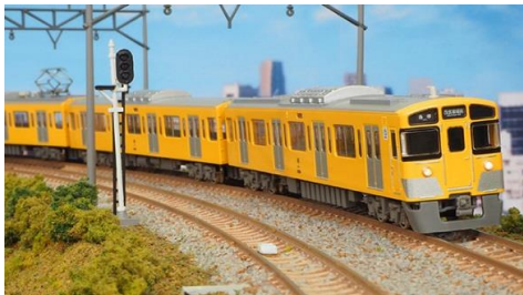
西武鉄道株式会社商品化許諾済

西武新2000系は、2000系のモデルチェンジ車として1988年に登場した車両で、2両固定編成～8両固定編成まで様々なバリエーションがあり、2000系各グループとの併結による長編成での運用が見られます。2000系との違いは、戸袋窓が復活し側面窓の天地寸法が拡大され1枚下降式となっています。前期形には前面貫通扉窓が大型化されているグループもあります。 前期形は当初新宿線に投入されました。新製後間もなく前面スカートが取り付けられ、その後4両編成のクモハのパンタグラフが撤去されました。2012年以降ベンチレータ撤去工事も進められています。 その後もリニューアル工事が施され、現在でも西武鉄道の主力車両として全線で活躍しています。