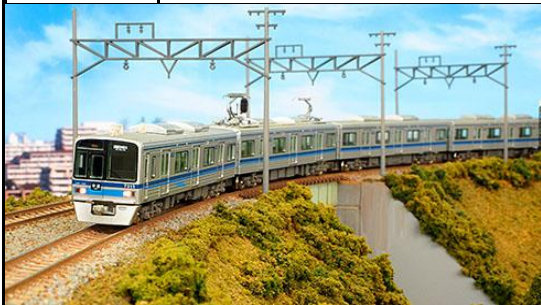
北総鉄道商品化許諾済

北総鉄道7300形は、1991(平成3)年3月の北総線京成高砂―新鎌ヶ谷間開業に伴い増備された18m3扉のステンレス車体にVVVFインバータ制御方式を採用した通勤型車両で、2編成が製造されました。京成電鉄3700形と共通の設計・仕様・性能を有する車両で、車体帯の色が北総カラーの青となっています。2007(平成19)年にはHOK'SOのロゴと先頭車側面の帯に航空機の翼をイメージしたアクセントが追加され、2015(平成27)年からパンタグラフがシングルアームタイプに換装され、窓ガラスにはグリーン系のUVカットガラスが採用されています。 7800形は、京成電鉄からのリース車両7050形・7250形を代替するため、同じく京成電鉄から3700形をリースにより導入したもので、2003(平成15)年に7808編成、2015(平成27)年に7818編成が登場しました。さらに2018(平成30)年には7828編成が同様に京成電鉄から3700形のリース車両として増備されています。